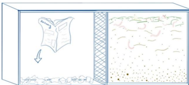
1 - Bereite die neue Kammer mit Zeitungspapier vor